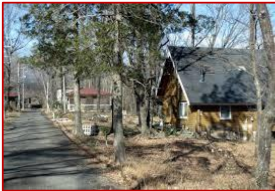
別荘地内イメージ