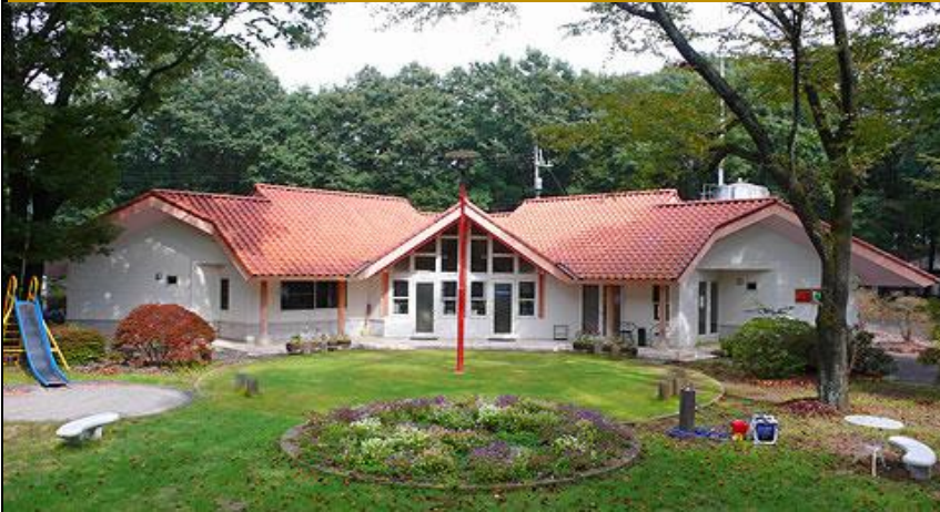
『赤城ロマンD』管理事務所